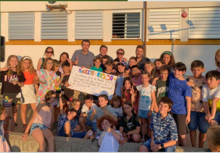
Participantes de la recaudación de fondos para apoyar a niños y niñas explotados en Mauritania

Esta iniciativa se concibe como un puente entre el conocimiento sobre el cambio climático y la activa defensa de los derechos infantiles. A través de programas educativos diseñados para las escuelas, nuestra meta es no sólo la comprensión, sino también la acción, involucrando a los niños en la protección de su entorno y en la defensa de sus derechos fundamentales.